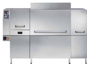
Laveuses à avancement automatique