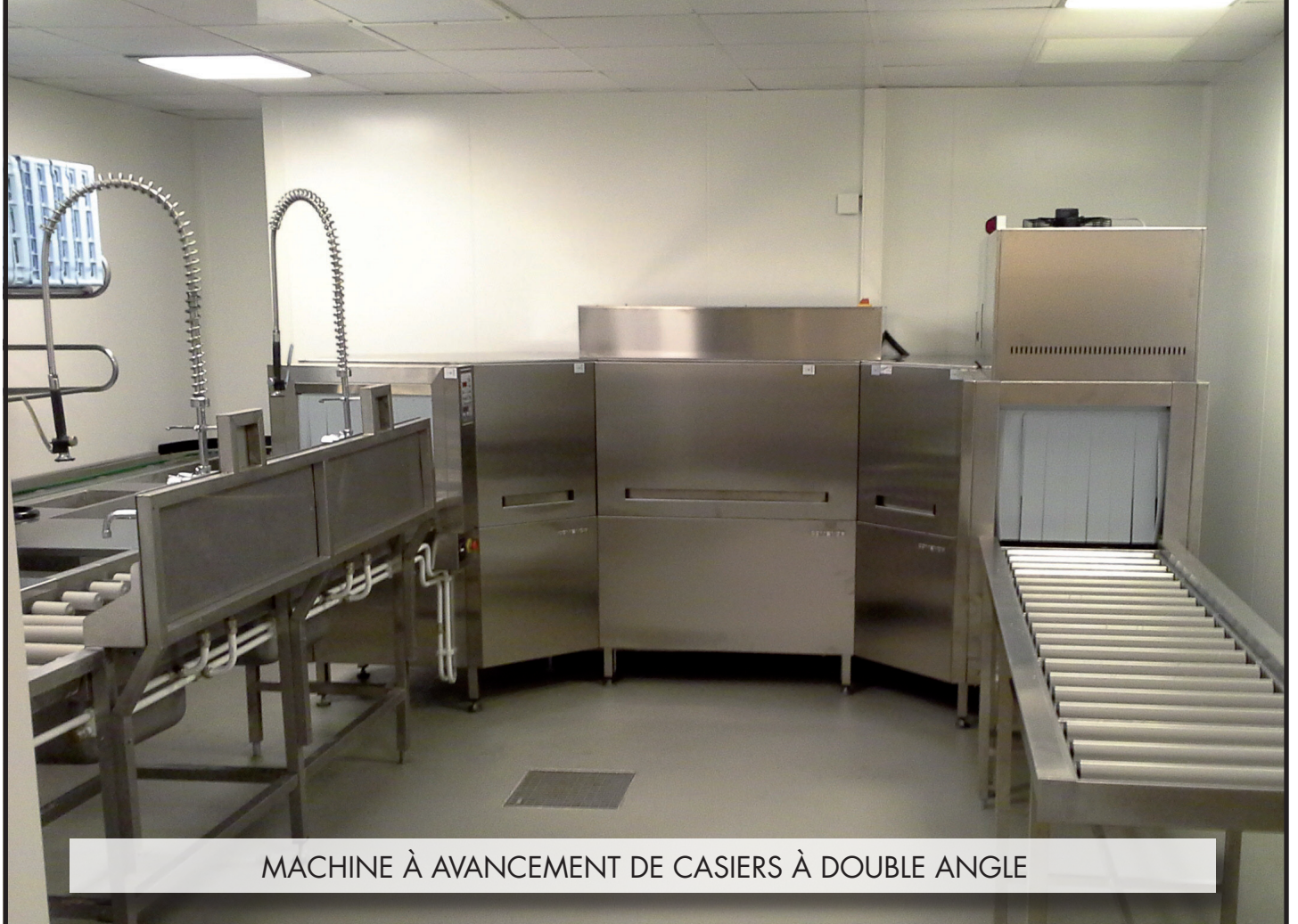
MACHINE À AVANCEMENT DE CASIERS À DOUBLE ANGLE