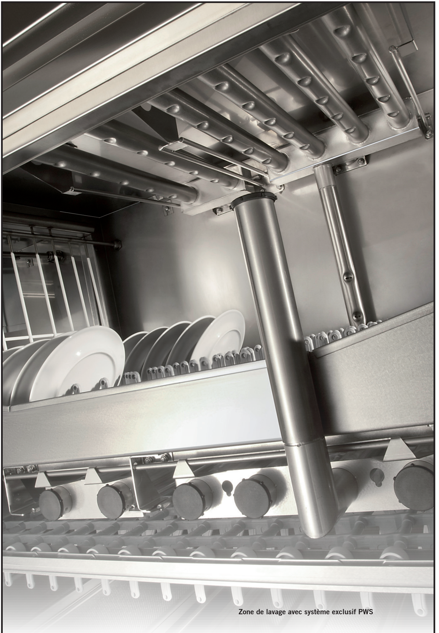
Zone de lavage avec système exclusif PWS