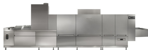
Laveuses à convoyeur